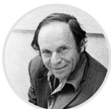
Philip Morrison (Филип Моррисон; 1915–2005): https://en.wikipedia.org/wiki/Philip_Morrison https://ru.wikipedia.org/wiki/Моррисон,_Филлип https://history.nasa.gov/EP-125/part3.htm