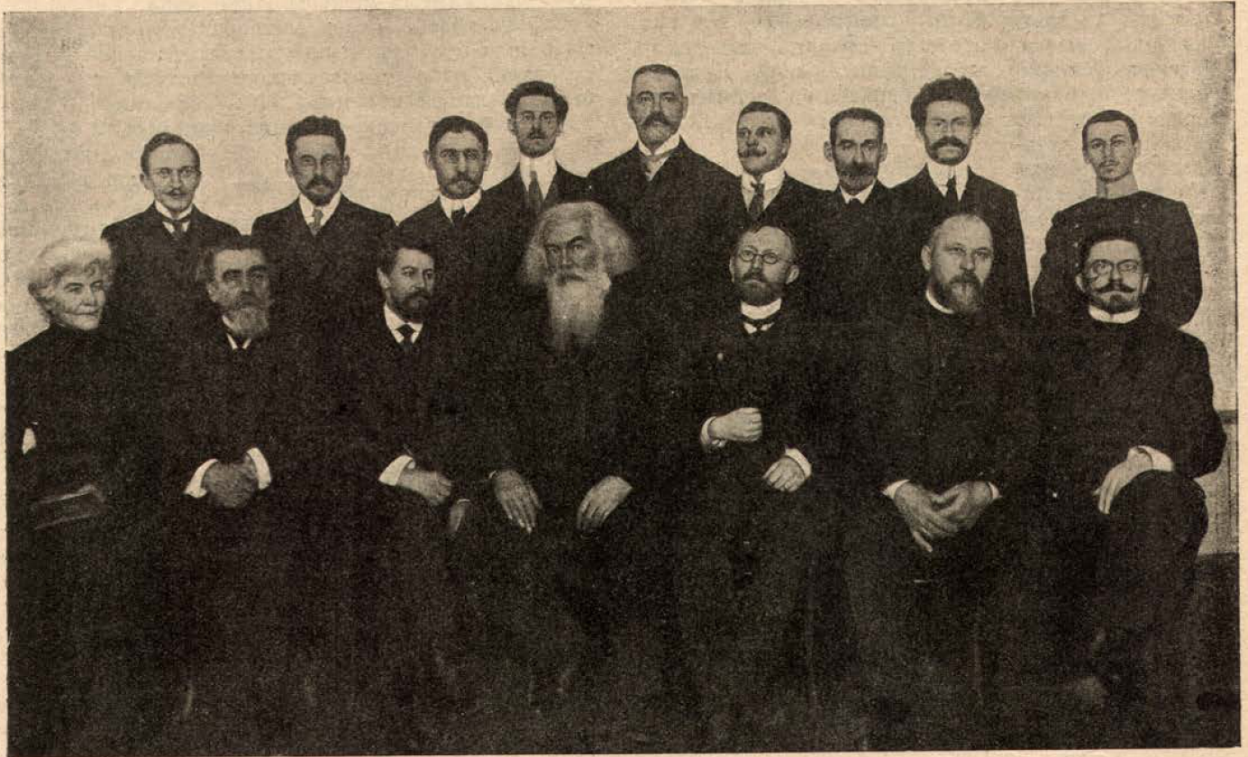
Редакція и группа петербургскихъ сотрудниковъ журнала „Природа и Люди“.

Самаго процесса печатанія на типографскомъ станкѣ мы описывать не станемъ—онъ извѣстенъ всякому. Замѣтимъ лишь, что изъ подъ машины номеръ выходитъ въ видѣ огромнаго, несложнаго листа бумаги; его надо еще сложить въ форматъ